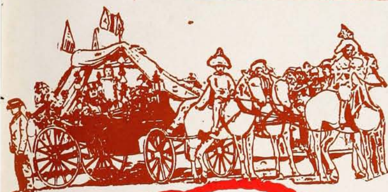
LA FETE NATIONALE dans l'Ouest de la ville.—Voiture portant le petit St-Jean-Baptiste